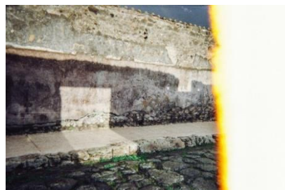
Vecchi Amici , Naples, 2017 Tirage sur Papier Satiné, 21x15 cm Cadre bois chêne, 36x29 cm

L'élagage de cette rue descendant vers le centre-ville laisse apparaître une connivence de longue date.