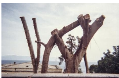
La Porta , Naples, 2017 Tirage sur Dibond 3 mm, 45x30 cm

Le soleil se couche à travers la porte d'une habitation détruite dans les ruines de la cité antique de Pompei