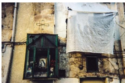
Ricordi , Naples, 2017 Tirage sur Dibond 3 mm, 90x60 cm

Une sélection de photographies de voyages entre Naples (Italie) et Chefchaouen (Maroc)